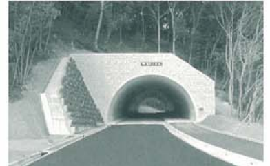
南淡路地区トンネル工事(兵庫県)