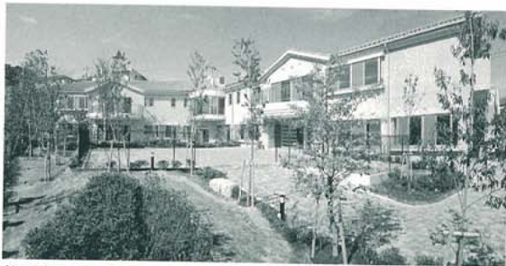
(仮称)アクティブライフ山芦屋新築工事(兵庫県)