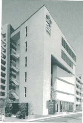
(仮称)今津メディカルセンター計画 (兵庫県)