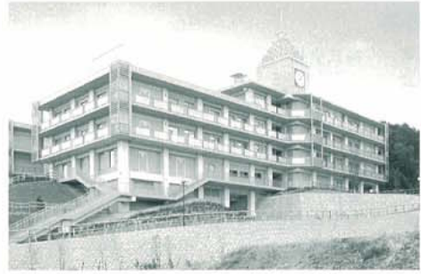
デイセンターとんがり帽子新築工事(大阪府)