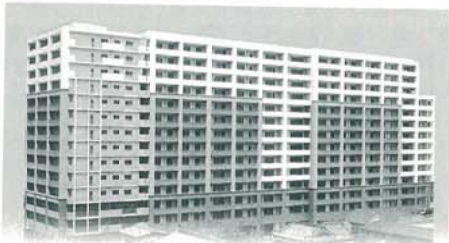
茨木市中津町集合住宅新築工事(大阪府)