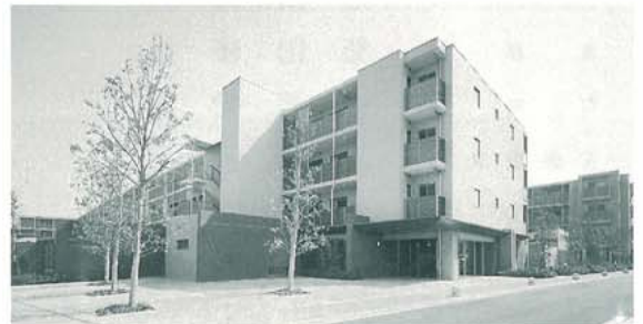
グランノア和泉多摩川新築工事(東京都)