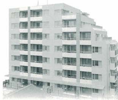
セフレック翠明 建設工事 (兵庫県)