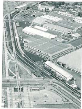
立川基地跡地関連地区 関連整備工事 (東京都)